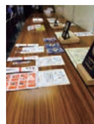
(表彰状・盾・賞品)